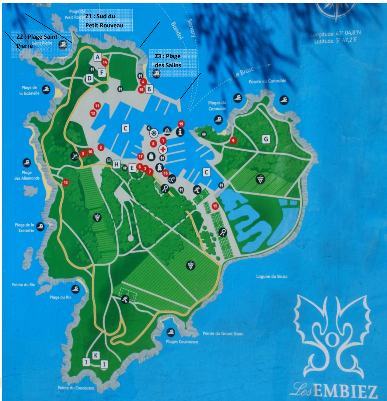
Carte 2 : Zones de mouillages pour le comptage

Le comptage des bateaux (moteurs et voiliers) au mouillage s'est fait sur 3 zones indiquées sur la carte ci-dessous.